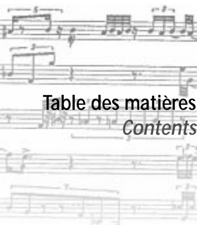
Table des matières Contents